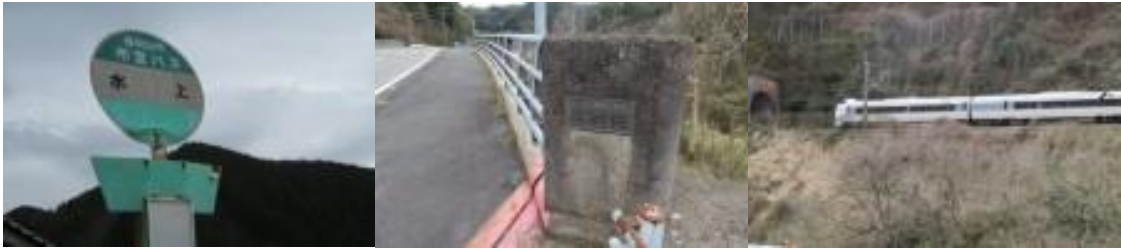
※氷上バス停（福知山市・市営バス）、広瀬橋、城崎方面の特急