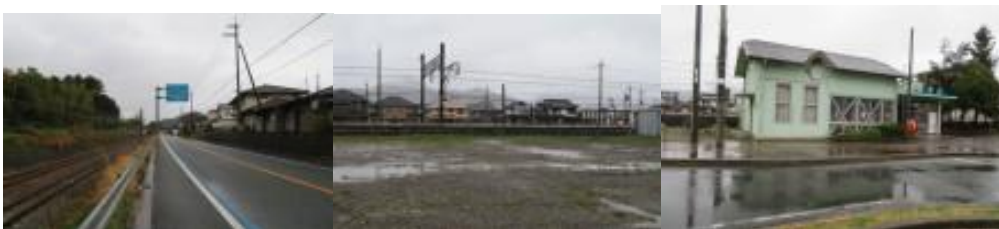
※石原駅への路、石原駅