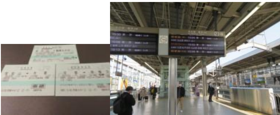
※復路の乗車券・特急券

13 時 56 分発のきのさき 16 号からひかり 656 号に乗り継いで家路に向かう。今回の旅は天候には恵まれなかったが、当初の目標が達成でき充実した 4 日間であった。同時に、京都から鳥取までの山陰本線と綾部から敦賀までの舞鶴線・小浜線の踏破が微かに見えて来た旅でもあった。(完)