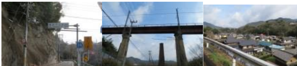
※26号線にあった下山駅への標識、高屋川橋梁、26号線からの下山住宅街

営バスが停まっていた。この区間、右往左往で10分位ロスタイムが生じたが、概ね順調に踏破できた。