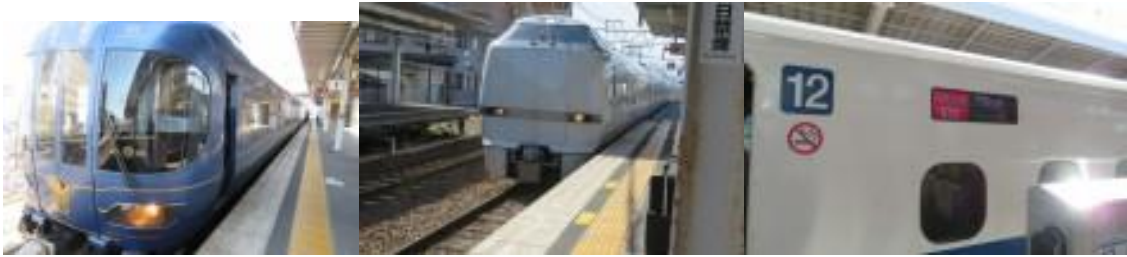
※京都丹波鉄道の車両、きのさき 16 号、ひかり 656 号