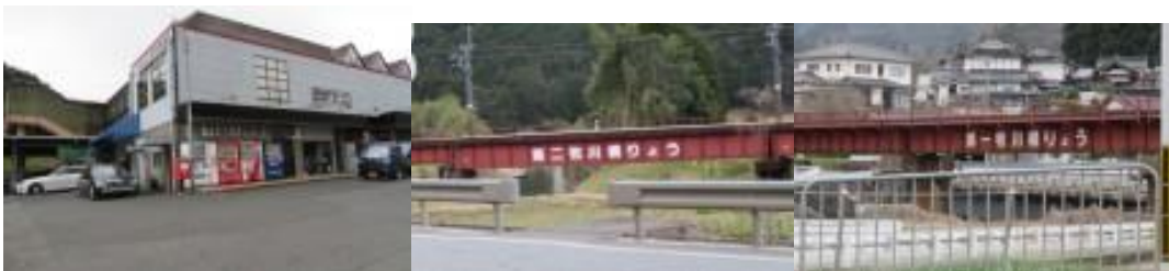
※車窓から見えた〇〇工業の看板、第二牧川橋りょう、第一牧川橋りょう

④15時46分、京都100km、京丹波53kmと記した道路標識前を通過。右手には97歩ある畑川橋側道橋を渡る。15時53分、153mある夜久野トンネルを渡る。16時10分、福知山発下夜久野行きの路線バスと対面する。ここから上川口駅は遠かった。少し肌寒くなる。やっと牧川を渡って、線路に近づくや否や、上手くいけば間にある電車（上川口17時24分発）が私の前を通過して行く。少し手前でジョギングすれば、この電車に間に合っただろう。少し後悔もしたが、リュックを背負ってのジョギングは厳しいと判断し断念。上川口駅には17時30分到着。次の福知山行きは18時39分で1時間9分の待ち合わせとなる。夏場であれば、待ち時間回避のため、6.7km先の福知山駅を目指したかも知れないが。