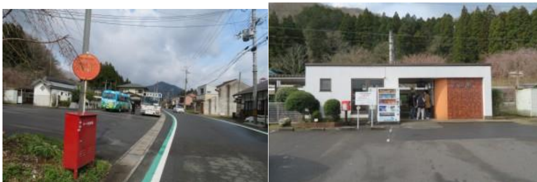
※下山駅への路、下山駅