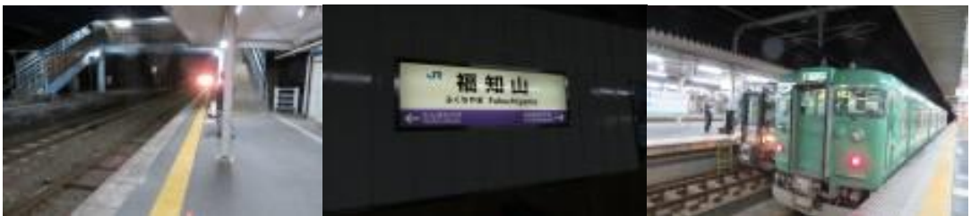
※上川口駅、福知山駅

⑤上川口駅前にはコンビニも自動販売機をなく、長い 69 分であった。やっと 18 時 39 分発の福知山行きがやって来て、福知山駅に移動。そして、2 年前に宿泊したことのあ る福知山アートホテルにチェックイン。懐かしい思い出が蘇る。ホテル紹介の”大八車 ろばた店”に出向き、本日の疲れを癒す。