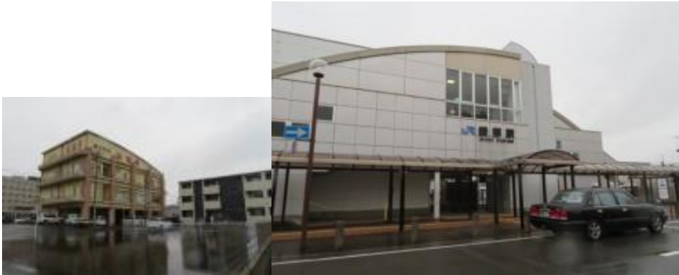
※栄温泉、綾部駅南口