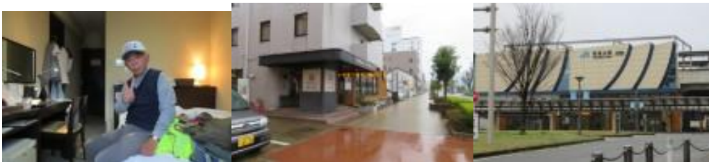
※ホテルレストラン”和楽”で朝食、福知山駅北口

2021年3月21日（日）雨、山陰本線の踏破旅の二日目は、上川口駅から綾部駅までの営業キロ19kmに挑戦する。途中、福知山城に立ち寄り30分位鑑賞する。当初は胡麻駅から綾部駅を予定していたが、本日の天候を配慮し、順番を入れ替える。本日は、営業キロも19kmと短いし、福知山駅から綾部駅までは概ね府道8号線に沿った路筋であったので、当初予定していた福知山7時1分発を遅らせ、次発の8時54分とする。その結果、ホテルのレストラン和楽でゆっくり朝食をとって臨むことができる。雨の中でのウォーキングであったので、メモの回数やデジカメによる撮影は少なくなることを余儀なくされる。