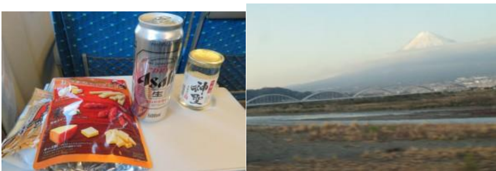
※新幹線で祝杯、富士川からの富士山

13 時 56 分発のきのさき 16 号からひかり 656 号に乗り継いで家路に向かう。今回の旅は天候には恵まれなかったが、当初の目標が達成でき充実した 4 日間であった。同時に、京都から鳥取までの山陰本線と綾部から敦賀までの舞鶴線・小浜線の踏破が微かに見えて来た旅でもあった。(完)