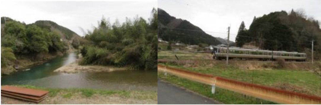
※牧川、上川口 7 時 24 分の電車