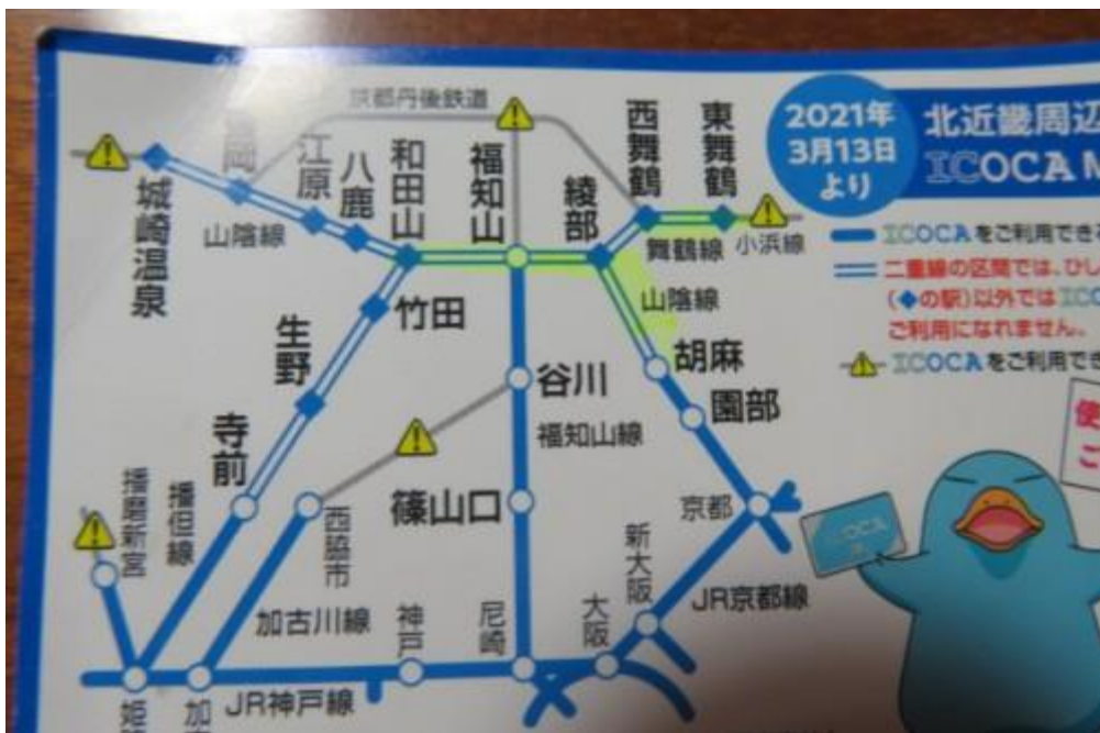
※踏破した鉄道の路線図

2021年3月20日（土）～3月23日（火）の3泊4日の山陰本線の旅は、悪天候にも関わらず、当初の予定通り胡麻から和田山までの営業キロ71.9kmを踏破できる。また、舞鶴線（綾部～東舞鶴：営業キロ26.4km）のうち、東舞鶴から西舞鶴までの営業キロ6.9kmも踏破できる。無論全駅舎立ち寄りにも成功。