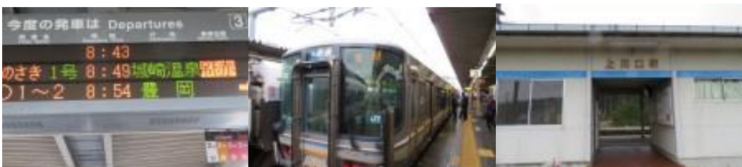
※福知山駅、上川口駅