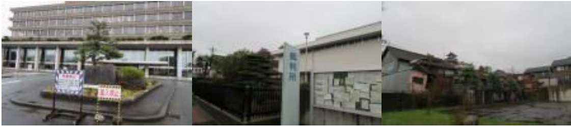
※福知山市庁、福知山簡易裁判所、福知山城

12時31分、JR線下を潜り、鉄道の右側となる。国道9号線（大阪方面）から分岐した府道8号線を歩く。12時39分、347歩ある土師川（はぜがわ）を渡る。ここから石原駅は遠かった。雨の中を淡々と歩く。13時43分、石原駅に到着する。自動販売機でアイスを購入して一息入れる。