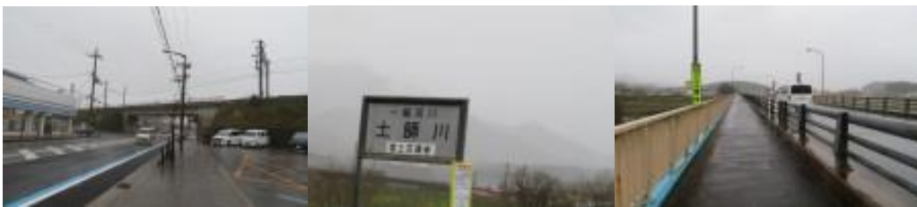
※JR下を潜り、土師川を渡る

12時31分、JR線下を潜り、鉄道の右側となる。国道9号線（大阪方面）から分岐した府道8号線を歩く。12時39分、347歩ある土師川（はぜがわ）を渡る。ここから石原駅は遠かった。雨の中を淡々と歩く。13時43分、石原駅に到着する。自動販売機でアイスを購入して一息入れる。