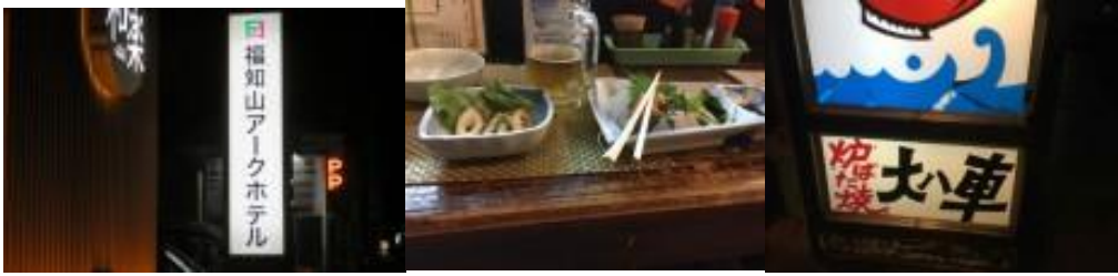
※福知山アークホテル、大八車で祝杯！！