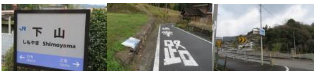
※下山駅、80号線への路、黒瀬橋交差点

②胡麻駅から200m直進するが、80号線には出られず躊躇する。地元の人に偶然にも対面し、リカバリー方法を教えて頂く。それで駅前まで戻り、80号線に繋がる道路(9時52分)を下る。9時57分、80号線に繋がる黒瀬橋交差点に出る。その先で舞鶴51km、綾部25kmと記した道路標識があった。10時16分、藤ヶ瀬交差点で国道27号線に合流する。10時38分、敦賀まで130km地点に到達。